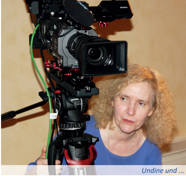
Undine und ...