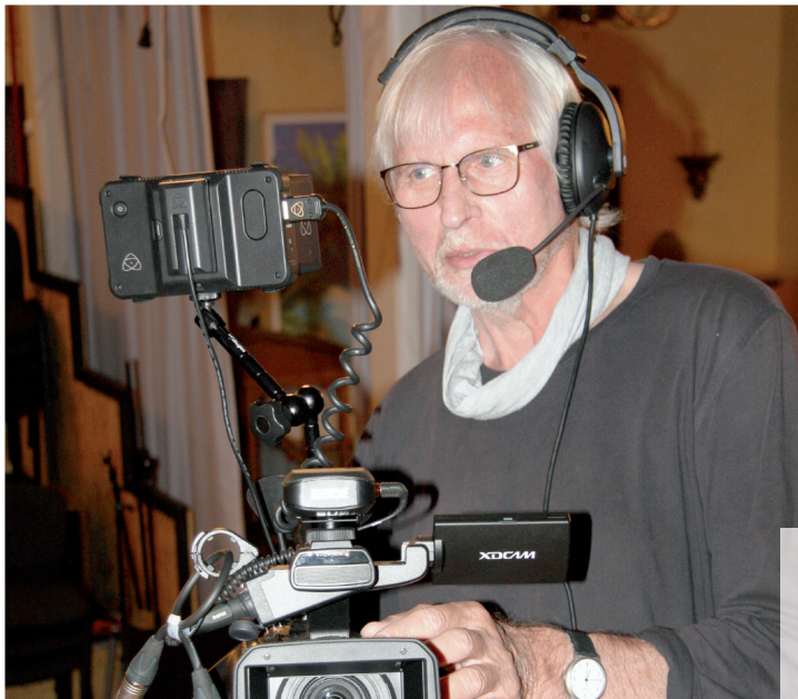
Das Team des Theaters hat schon sehr viel gelernt und freundet sich immer mehr mit dem Medium „Film“ an - ob vor oder hinter der Kamera.